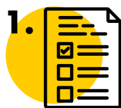
EXAMEN DE OPCIÓN MÚLTIPLE