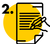
TRABAJO O TESIS