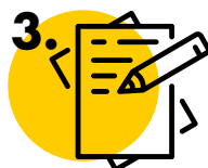
EJERCICIOS Y EXAMEN