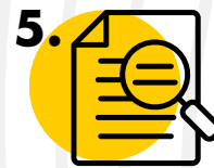
ANÁLISIS DE SENTENCIAS